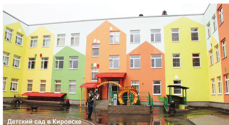
Детский сад в Кировске

дняшний день в числе самых крупных дошкольных учреждений. Здания отвечают всем современным требованиям. Дошкольные учреждения оснащены новейшим спортивным оборудованием, уютными детскими спальнями и игровыми комнатами, отвечающими требованиям санитарных норм, кабинетами психолога, учителей-логопедов, красивыми музыкальными залами. Пищеблок оснащен по последнему слову техники. Для малышей будут готовить не только вкусную, но и полезную еду. Территория детских садов также полностью благоустроена. На игровых площадках стоят новые теневые навесы и игровые комплексы. Все прогулочные участки имеют декоративное озеленение и в теплое время года будут сиять красками цветов не менее ярко, чем сами здания садов. Большое внимание уделено и безопасности воспитанников. В учреждениях установлены современная автоматическая пожарная сигнализация, система видеонаблюдения, территории огорожены высокими заборами. Другими словами, созданы все условия для наших детей.