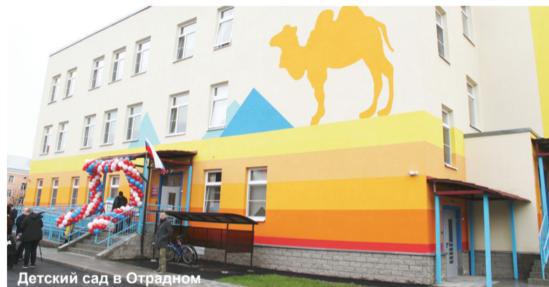
Детский сад в Отрадном