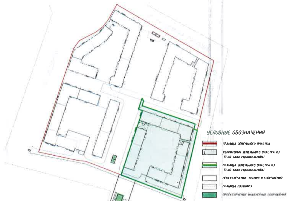
СХЕМА РАЗМЕЩЕНИЯ ОБЪЕКТА

Приложение №2 к Изменению №4 от 31.07.2017 г. в Проектную декларацию от 15.02.2017 года, опубликованную на сайте www.bonava.ru О проекте строительства Многоквартирного жилого комплекса со встроенно-пристроенными помещениями, встроенно-пристроенными объектами дошкольного образования и встроенно-пристроенным подземным гаражом по адресу: г. Санкт-Петербург, Аптекарский проспект.д.16, лит.Б , кадастровый номер земельного участка 78:07:0003299:1234 3 этап строительства (секции К31-К39)