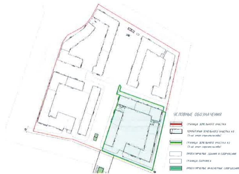
СХЕМА РАЗМЕЩЕНИЯ ОБЪЕКТА

Приложение №2 к Изменению № 6 от 08.12.2017 г. в Проектную декларацию от 15.02.2017 года, опубликованную на сайте www.bonava.ru О проекте строительства Многоквартирного жилого комплекса со встроенно-пристроенными помещениями, встроенно-пристроенными объектами дошкольного образования и встроенно-пристроенным подземным гаражом по адресу: г. Санкт-Петербург, Аптекарский проспект.д.16, лит.Б , кадастровый номер земельного участка 78:07:0003299:1234 3 этап строительства (секции К31-К39)