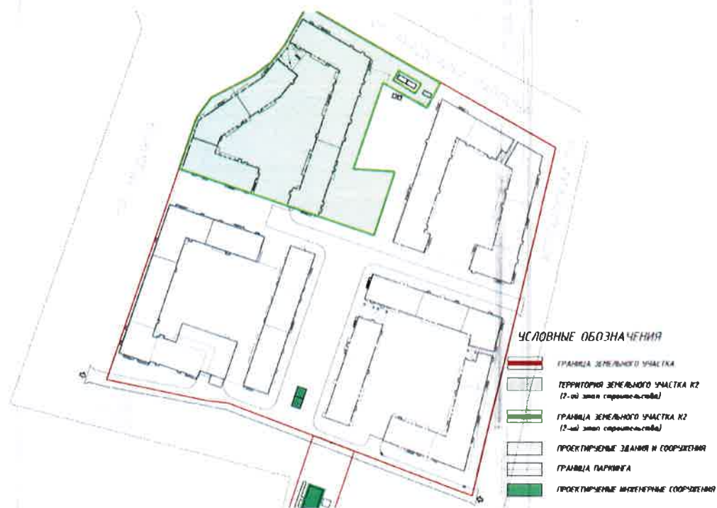
СХЕМА РАЗМЕЩЕНИЯ ОБЪЕКТА

г. Санкт-Петербург, Аптекарский проспект.д.16, лит.Б , кадастровый номер земельного участка 78:07:0003299:1234 2 этап строительства (секции К21-К28)